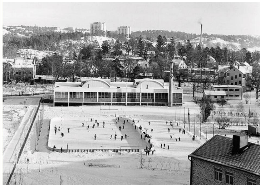
Sicklavallen på 50-talet

Sickla IF har en lång historia i detaljplaneområdet. 1938 bildas Atlas Copco IF. Föreningen är verksam lokalt för boende i Sicklaområdet. Från 50-talet och framåt har föreningen tillgång till en 11-spelarplan där nuvarande Sicklavallen ligger samt en sporthall där Plantagen ligger idag och en gymnastiksal där Sickla skolas matsal ligger idag. Då Atlas Copco inte längre har en aktiv del i föreningen byter föreningen namn till Sickla IF 2007/2008.