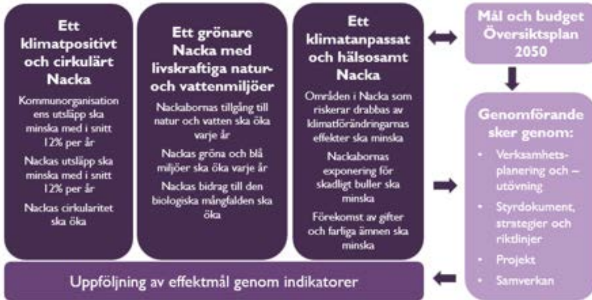
Figur 3 Målen är strategiska och vägledande, och omfattar hela kommunorganisationen. De behöver omsättas av respektive nämnd och bolagsstyrelse för vidare genomförande

För att klimat- och miljömålen ska uppnås behöver de konkretiseras ytterligare och integreras i verksamheternas dagliga arbete och i kommunens övriga styrdokument. Kommunens arbete styrs till stor del genom Mål och budget , som fastställs av kommunfullmäktige varje år. För störst effekt behöver de mål och den budget som fastslås löpande bidra till att vi når klimat- och miljömålen. Eftersom klimat- och miljöprogrammets mål sträcker sig över flera mandatperioder är genomförandet beroende av de prioriteringar och ekonomiska förutsättningar som ges i kommunfullmäktiges årliga beslut. Varje nämnd och bolagsstyrelse ansvarar för att, utifrån sina uppdrag och budgetförutsättningar, integrera klimat- och miljöprogrammets mål i sina verksamhetsplaner och aktiviteter.